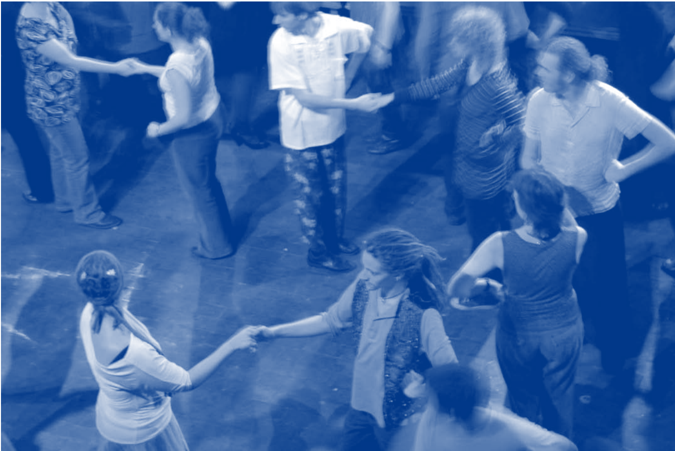
Forum voor Amateurkunsten. stART '08

De amateurkunstensector is een zeer diverse sector. Het amateurkunstendecreet geeft er volgende definitie aan: 'elke kunstvorm die in het kader van het sociaal-culturele gebeuren aan iedere burger de kans biedt om zich via kunstbeoefening en -beleving te ontplooien en zijn potentiële creatieve vermogens te ontwikkelen op vrijwillige basis en zonder beroepsmatige doeleinden'. Hieronder vallen tal van beoefenaars die actief zijn in één van volgende disciplines: muziek, beeldhouwen, dans, theater, film, fotografie, zang, multimedia, DJ'en, schilderen en schrijven.