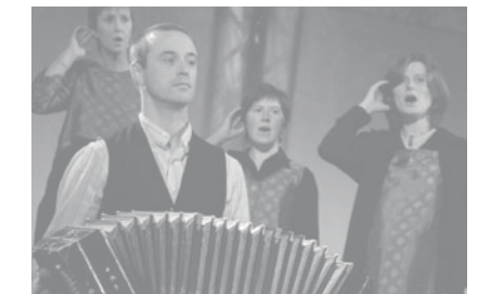
Koor&Stem / Arabeske

Kunstbeoefening kent geen landsgrenzen. Kunst is een ideaal instrument om internationale verbanden te leggen en samenwerking aan te gaan. Bovendien moeten we ook nog meer met onze creativiteit naar buiten komen en zoveel mogelijk ervaringsuitwisseling faciliteren. Daarom het belang van internationale netwerken en profilering. De middelen voor het reglement internationale zijn al jaren vroegtijdig uitgeput, waardoor vele groepen uit de boot vallen. Wanneer wordt ingezet op de internationale uitstraling en expertisevorming van de amateurkunsten, dan dient dit budget aanzienlijk verhoogd.