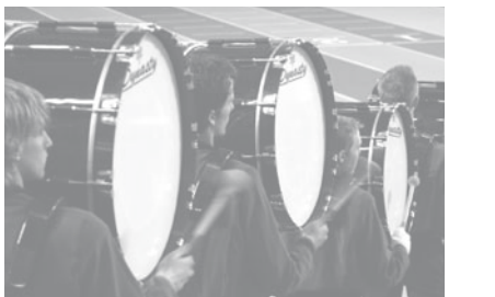
Vlamo / Masters of Percussion

Als cement van het samenlevingsgebouw moet cultuur ook een zaak zijn van kwetsbare groepen in de samenleving. Dat veronderstelt een sociale omkadering om het culturele potentieel van deze mensen aan te spreken. Vandaar het belang dat we hechten aan sociaal-artistieke initiatieven. Een recente tendens in de toenadering tussen de sociale en de artistieke praktijk is juist het opzetten van dergelijke initiatieven. De amateurkunstensector kan dit mee voeden en er zelf deel van uitmaken.