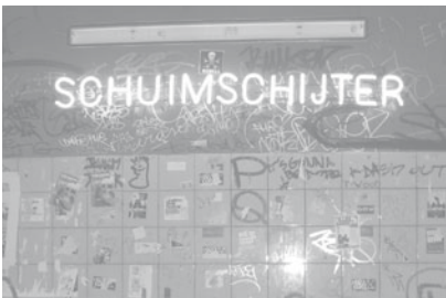
Centrum voor Beeldexpressie / Photo Event