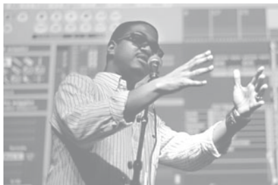
Poppunt / Muzikantendag

Tevens kan de amateurkunstensector zich inschakelen in het veelbelovende concept van de Brede School.