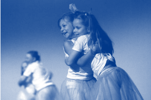
Winnaar fotowedstrijd WAK '08

lijke amateurkunstenuorganisatie per kunstdiscipline of deeldiscipline. De amateurkunstensector is bijgevolg door de Vlaamse overheid gestructureerd in negen landelijke, pluralistische amateurkunstenuorganisaties. Deze zijn: Kunstwerk[t] (beeldende kunst), Koor&Stem (vocale muziek), Opendoek (theater), Vlamo (instrumentale muziek), Muziekmozaïek (folk en jazz), Danspunt (dans), Centrum voor Beeldexpressie (beeldcultuur), Poppunt (lichte muziek) en Creatief Schrijven (letteren). Zij worden gesubsidieerd op basis van een beleidsplan voor een periode van 5 jaar.